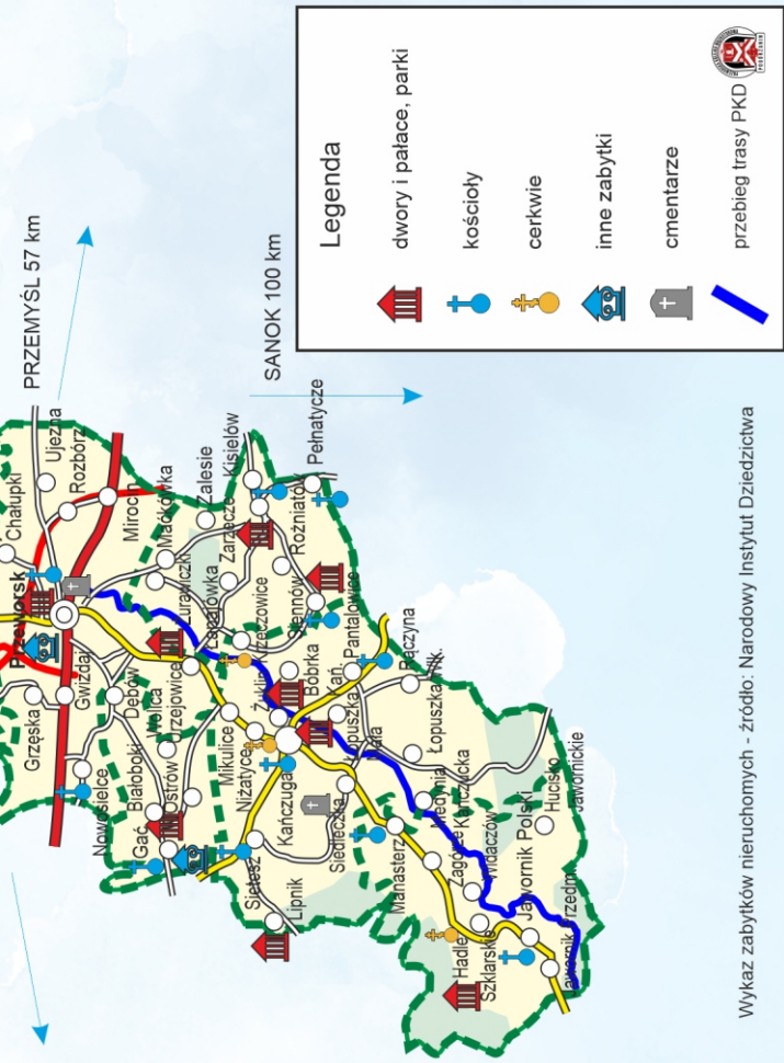
Wykaz zabytków nieruchomych